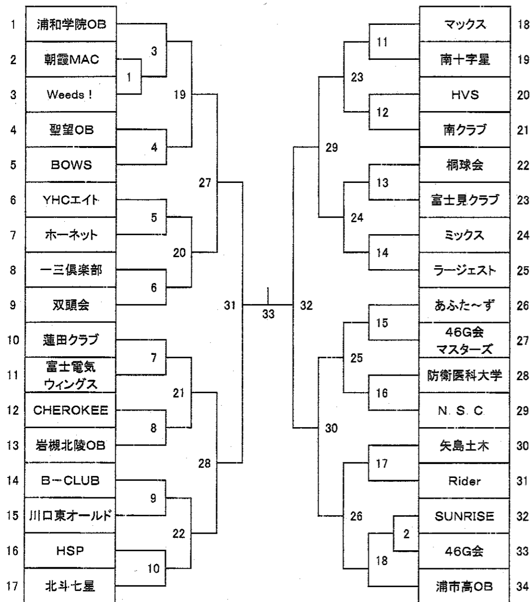
平成18年度埼玉県総合ハンドボール選手権大会組み合わせ(男子)